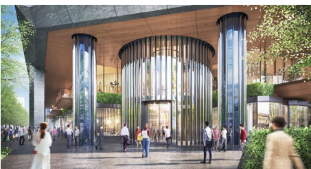
メインエントランス