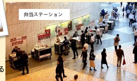
弁当ステーション

飲食店はおよそ30店舗あり、お昼の時間帯にはグランドロビーにて各ショップ、レストランが参加する弁当ステーションもあり、にぎわいを見せております。