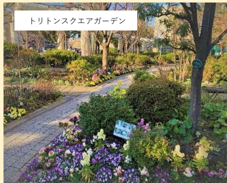
トリトンスクエアガーデン

建物の外には四季折々の緑あふれる空間があり、休憩時間に外に出るとリフレッシュできます。