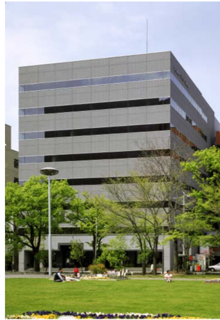
住友商事・フカミヤ大通ビル