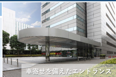
車寄せを備えたエントランス