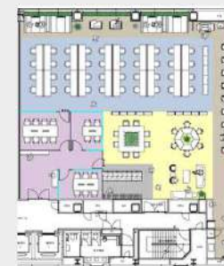
10F (東) 区画