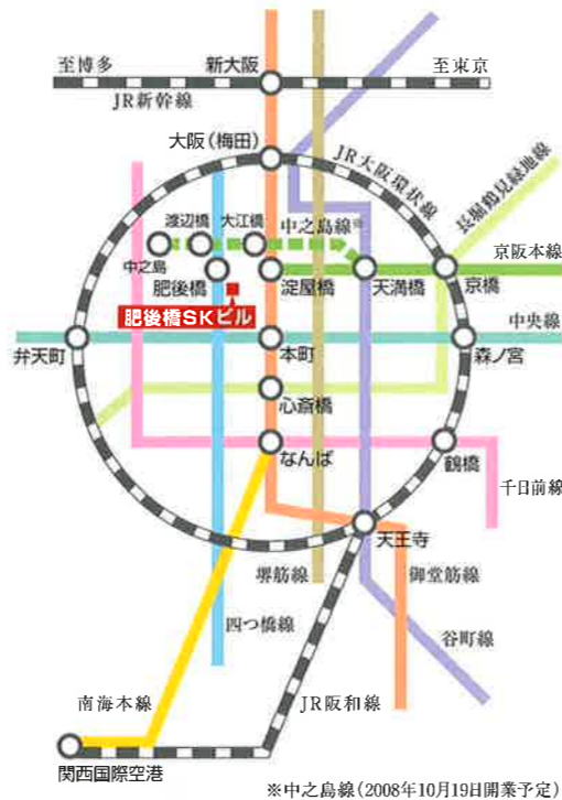
※中之島線(2008年10月19日開業予定)

優良企業が集積し、通勤も便利で人材が集 まりやすいオフィスの一等地。落ち着いた街 並みの事務所で、貴社のビジネスの信用力も ますますアップ。